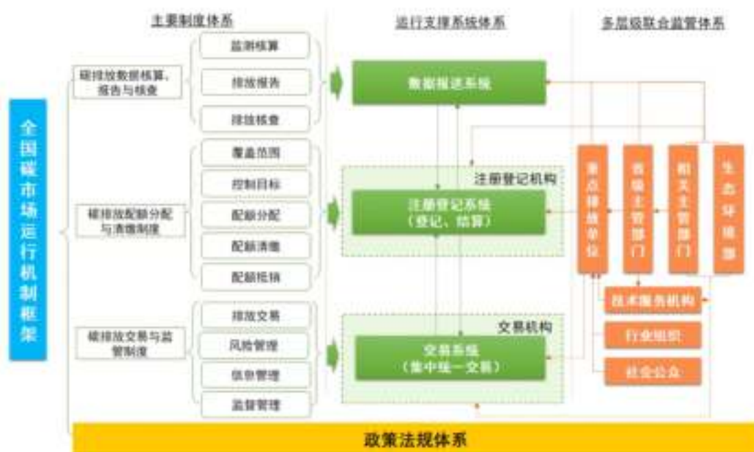
图3 全国碳市场运行机制框架

组织开展碳排放配额分配和清缴、温室气体排放报告的核查等相关活动，并进行监督管理。设区的市级生态环境主管部门负责配合省级生态环境主管部门落实相关具体工作，并根据有关规定实施监督管理。重点排放单位报告碳排放数据，清缴碳排放配额，公开交易及相关活动信息，并接受生态环境主管部门的监督管理。全国碳市场通过市场机制形成价格信号，引导碳减排资源的优化配置，从而降低全社会减排成本，推动绿色低碳产业投资，引导资金流动。