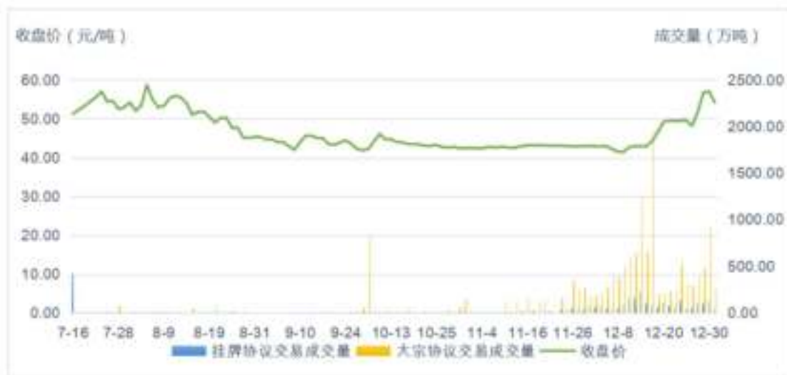
图1 全国碳市场第一个履约周期量价走势图

全国碳市场第一个履约周期纳入的重点排放单位为发电行业（含其他行业自备电厂）2013-2019年任一年排放达到2.6万吨二氧化碳当量（综合能源消费量约1万吨标准煤）及以上的企业或者其他经济组织，共2162家重点排放单位，年度覆盖二氧化碳排放量约45亿吨，是全球覆盖排放量规模最大的碳市场。截至2021年12月31日，第一个履约周期共运行114个交易日，碳排放配额累计成交量1.79亿吨，累计成交金额76.61亿元，成交均价42.85元/吨，每日收盘价在40~60元/吨之间波动，价格总体稳中有升（如图1所示）。